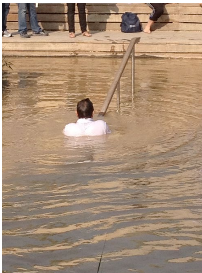
Man badar i Jordanfloden