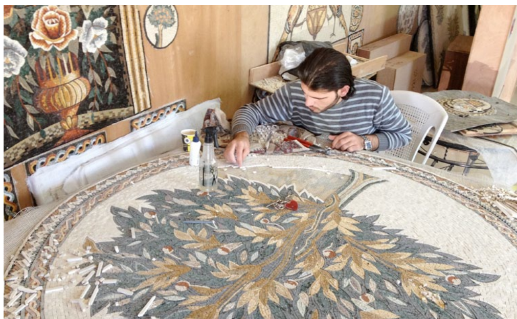
Rörelsehindrad man arbetar med mosaik

Kassan är tom. brödpriserna stiger, bensinen är dyr och några fria pengar syns inte vid horisonten. ”