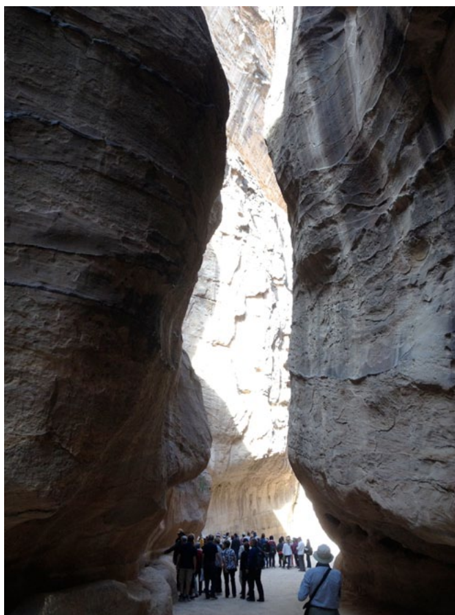
På vägen till Petra

Ja men hur är det med marken då. Palestinier har ju lämnat många områden, hur gör man med dem? ”Du måste förstå att Palestinierna och jorden är ett. Det är grunden i deras identitet. Nära nittio procent som tillfrågats vill tillbaka till hur det var 1948”. Men det går ju inte? ”Låt Palestinierna äga marken och Israeler bo och hyra den på livstid. Mycket