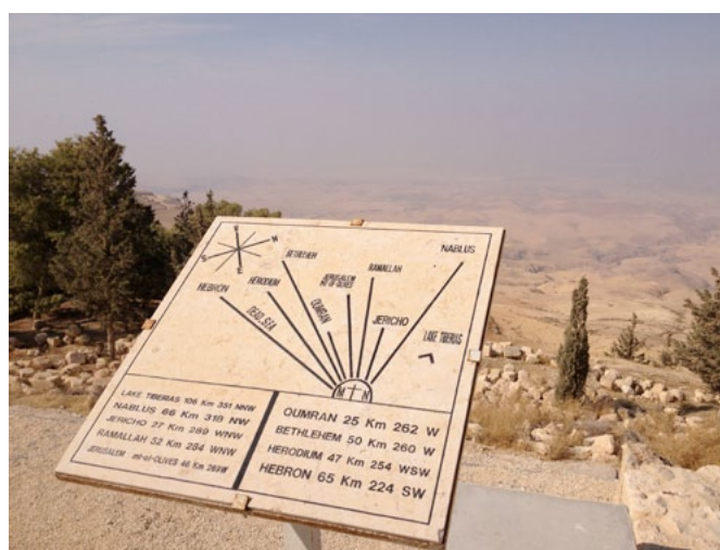
Berget där Moses blickade ut över det förlovade landet

Vad bra! Fantastiskt. Men vänta, till Amman? Till staden med sina huskroppar? Till dessa stenmonument